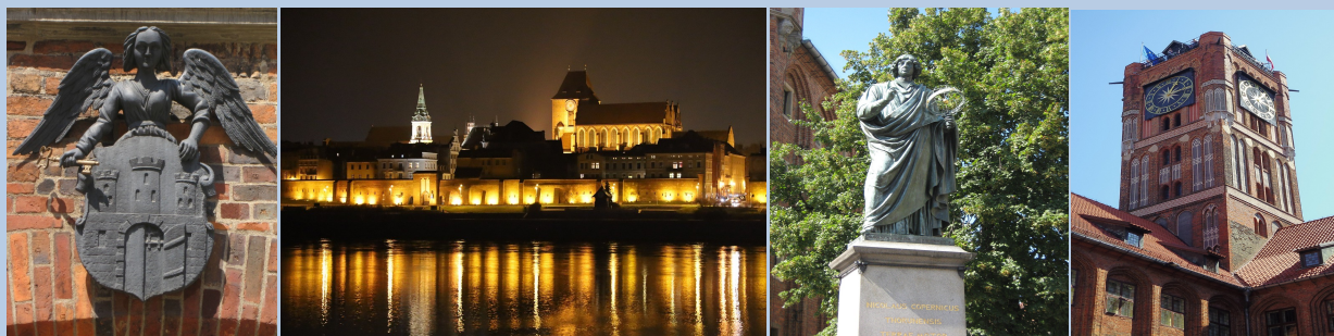
Miasto gospodarz: Toruń