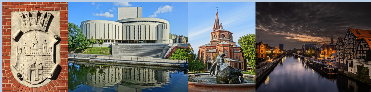
Miasto regionu: Bydgoszcz